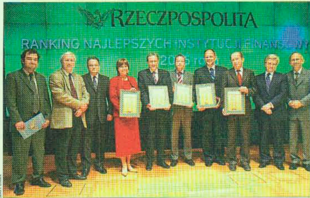
Ubiegły rok był bardzo dobry dla banków, ubezpieczycieli, towarzystw emerytalnych i funduszy inwestycyjnych. Potwierdzają to wyniki publikowane w rankingu „Rzeczpospolitej”. Jego laureaci odebrali wczoraj dyplomy dla najlepszych instytucji finansowych 2005 roku